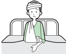
ケガをして入院した