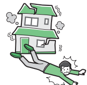
地震によりケガをした