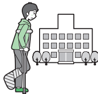
ケガをして通院した